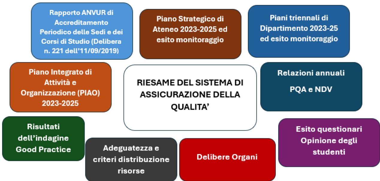
Diagramma 2 - Gli input informativi per il Riesame del Sistema di Assicurazione della Qualità

Di seguito una specifica per tutte le fonti informative sopra esposte con l'ultimo periodo di aggiornamento e il rimando alla pagina di pubblicazione (laddove disponibile):