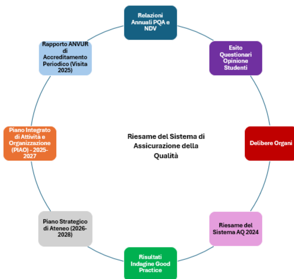
Diagramma 2 - Gli input informativi per il Riesame del Sistema di Assicurazione della Qualità

Si riepilogano di seguito gli input informativi identificati per la stesura del Riesame periodico del Sistema di Assicurazione della Qualità dell'Università degli Studi di Milano-Bicocca: